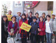
集合写真：茗荷谷駅にて

文京探索委員会 http://ebisawakeiko.com/tansaku/